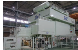
プレス機械 (サーボトランスファープレス)